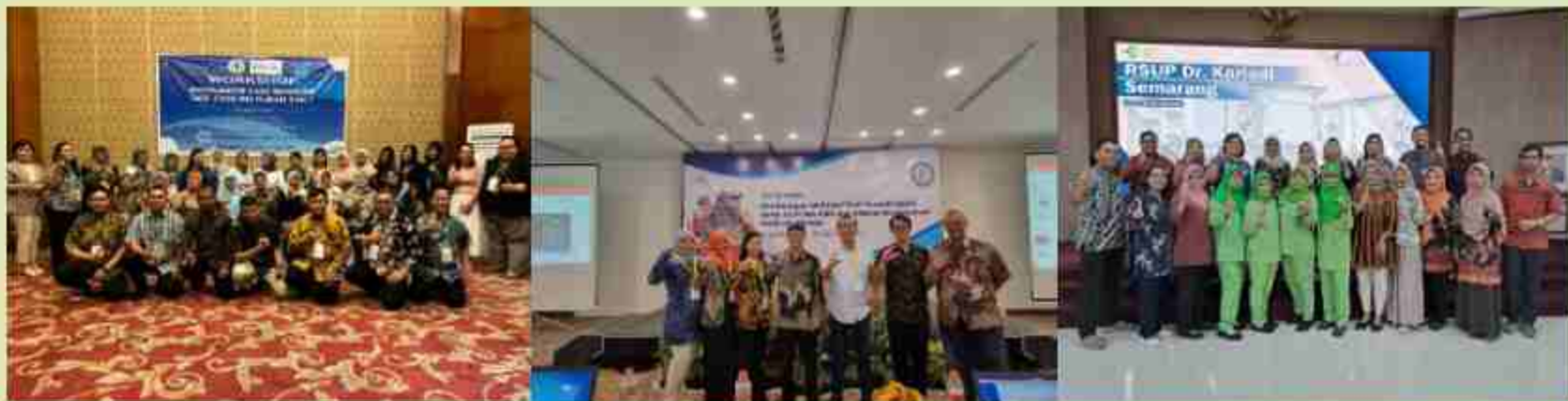
Pelatihan untuk meningkatkan kompetensi Eksternal