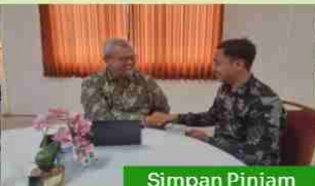
Simpan Pinjam Berbasis Syariah