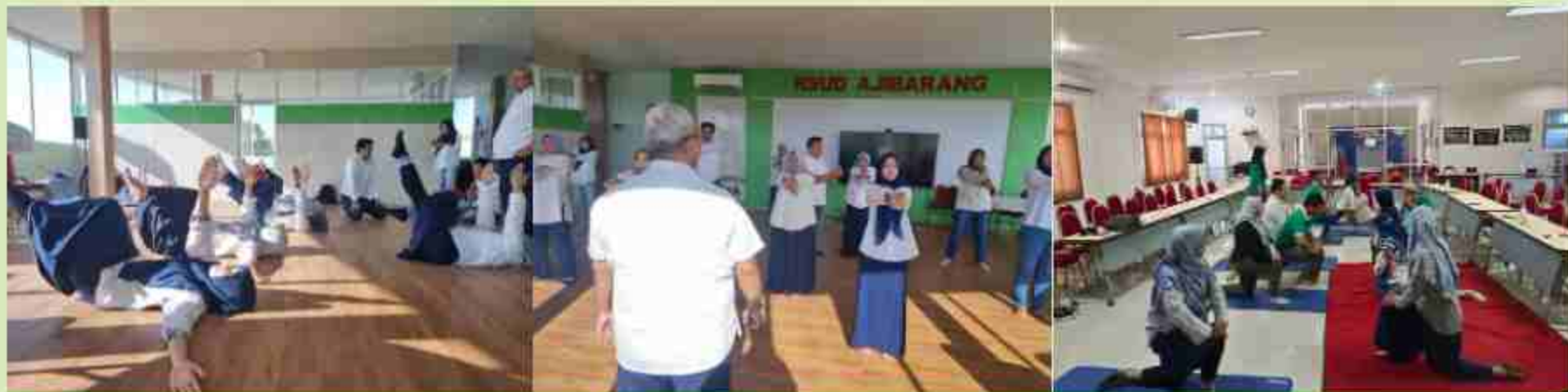
Senam Koreksi Postur