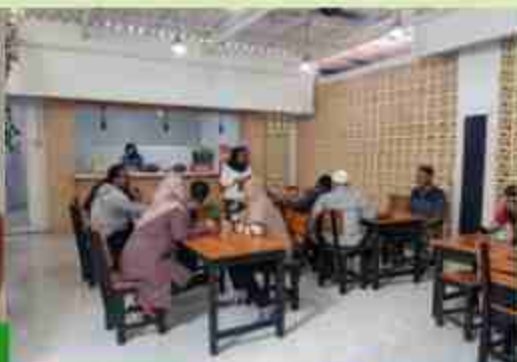
Makanan Siap Saji