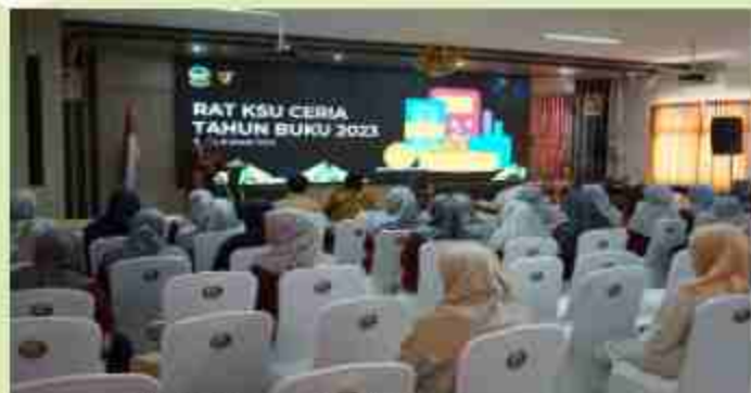
BISA HASIL USAHA ANGGOTA TAHUN 2023