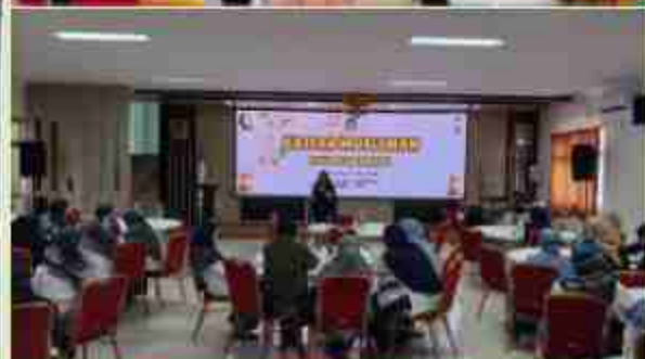
Kajian Muslimah setiap jumat pertama