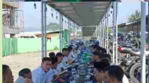
Mudarosah setiap jumat ke 2 dan 4